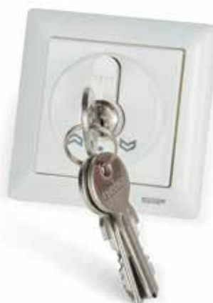
WSA 210 1161